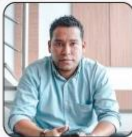
ECONOMISTA CONSULTOR DE MARKETING

Búsqueda de ropuesta fotográfica de lugares gastronómicos ilustración del diagrama canva Convocatorias en zoom para las actividades Reuniones Búsqueda de herramientas para materialización.